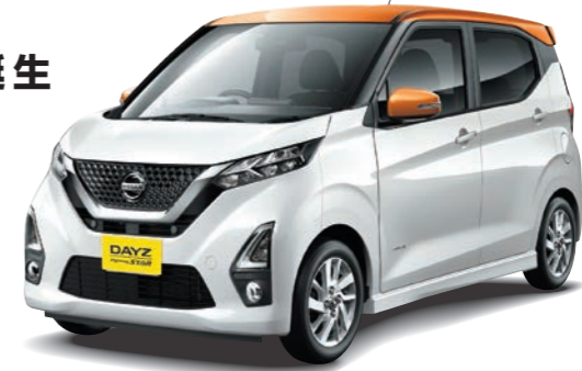
Photo:ハイウェイスターX プロパイロットエディション(2WD)。ボディカラーはホワイトパール(3P)/プレミアムシャイニングブルー(M) 2トーン(※XDT-特別塗装後色で54,800円(消費税別)高となります)。

急病時や危険を感じた時には、SOSコールスイッチを押してください。専門のオペレーターが警察や消防への連携をサポートします。万が一の事故発生時には、エアバッグ展開と連動し自動通報されます。