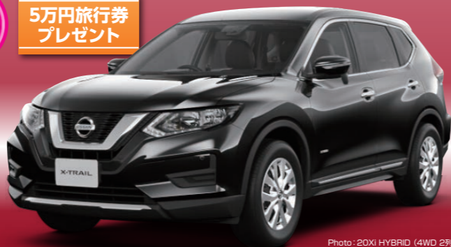
Photo: 20Xi HYBRID (4WD 2列シート)、ボディカラーはダイヤモンドブラック (P) (#G4) スクラッチシールド-特別塗装色43,200円 (消費税込)、内装色はブラック (G)。

残価設定型クレジット 4.9% 月々 12,900円 (2回目以降) 頭金 415,840円 所要資金 2,600,000円 初回支払い 14,756円 2回目以降 (x48回) 12,900円 ボーナス月 (x10回) 100,000円 最終回支払額 (総償額) 1,472,000円 合計 3,521,796円 ●ボーナス併用60回払い、契約走行距離1,000km/月で計算した一例です。●お支払い条件等により金額は変わります。●初回お支払い月/2019年10月 ●ボーナスお支払い月/12月7月